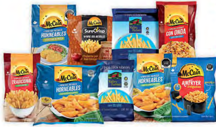
PAPAS CONGELADAS MCCAIN Y VALLEY FARMS