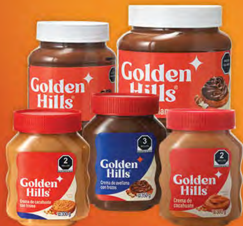
CREMA DE CACAHUATE Y AVELLANA GOLDEN HILLS