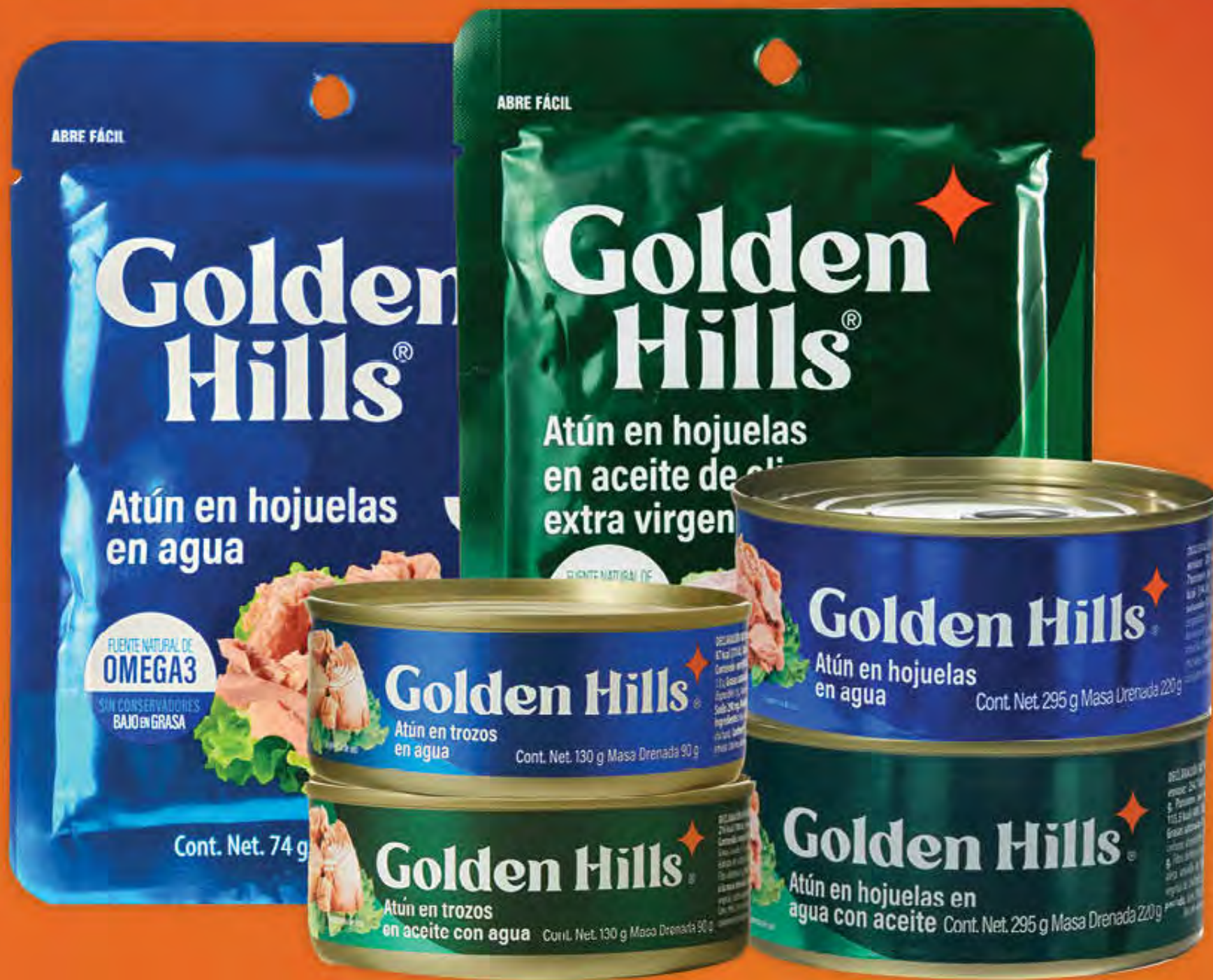
ATÚN GOLDEN HILLS