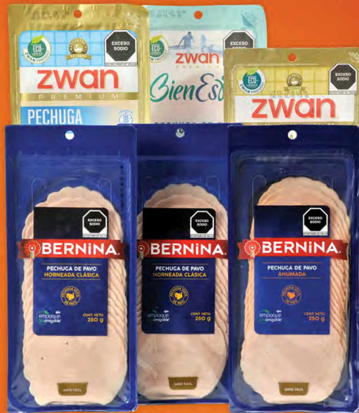
PECHUGAS EMPACADAS DE ORIGEN ZWAN Y BERNINA