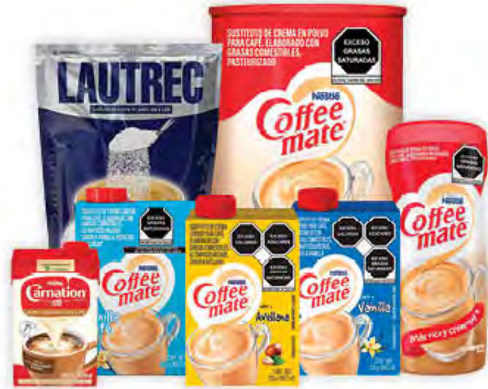
TODOS LOS SUSTITUTOS DE CREMA PARA CAFÉ

Vigencia del 10 al 18 de Junio de 2026 o hasta agotar existencias en tiendas que manejen estos productos. Beneficiamos a nuestros clientes, no aplica mayoreo. Excepto KE! PRECIO. "PAGA DOS Y TE REGALAMOS EL TERCERO DE IGUAL O MENOR PRECIO"