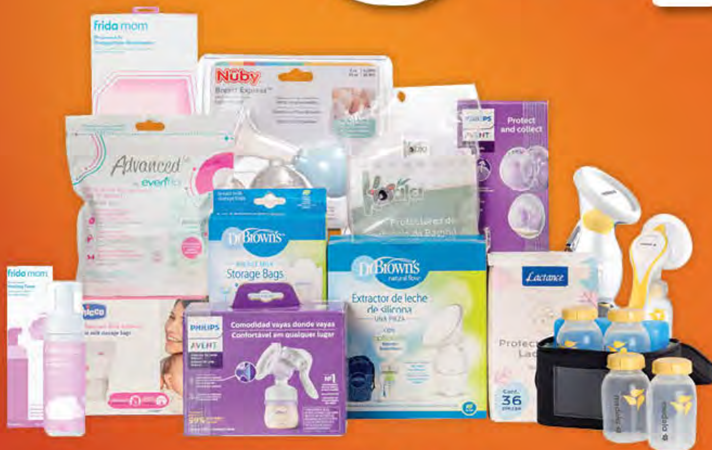
ACCESORIOS PARA LACTANCIA DEL DEPARTAMENTO DE BEBÉS