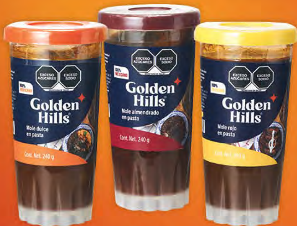
MOLES GOLDEN HILLS