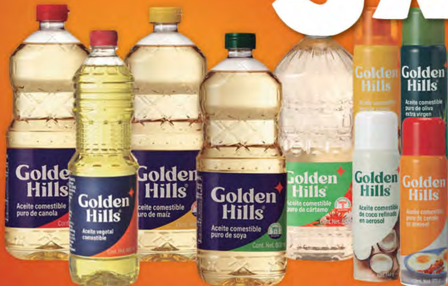
ACEITES COMESTIBLES GOLDEN HILLS