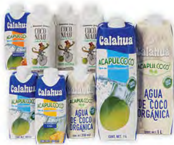
AGUA DE COCO CALAHUA Y NIAU