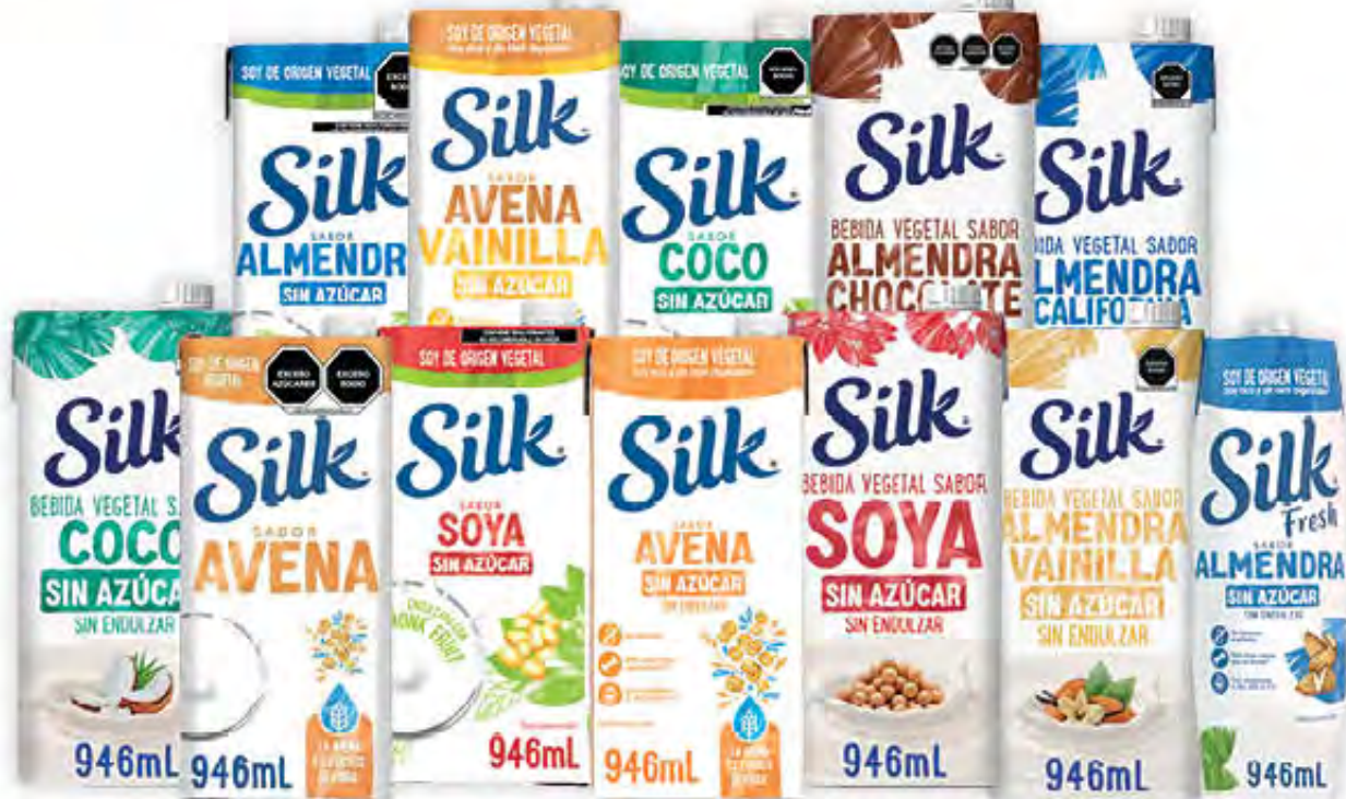
ALIMENTO LÍQUIDO SILK

Vigencia del 10 al 18 de junio de 2026 o hasta agotar existencias en tiendas que manejen estos productos. Beneficiamos a nuestros clientes, no aplica mayoreo. Excepto KE! PRECIO.