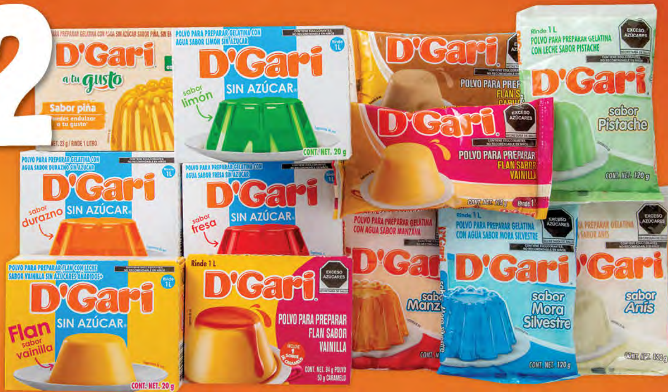
GELATINAS Y FLANES D'GARI