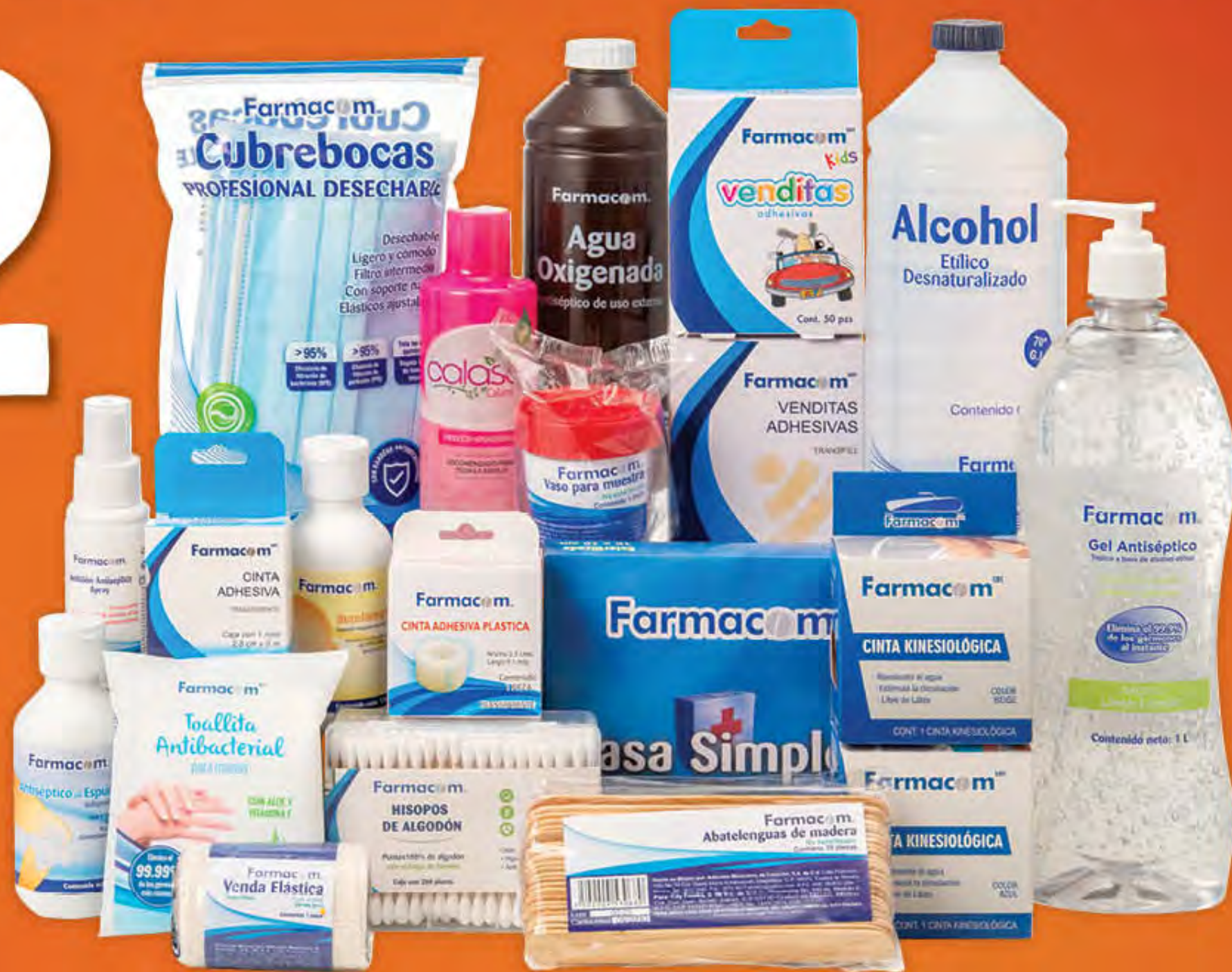
MATERIAL DE CURACIÓN, GEL ANTIBACTERIAL Y DESINFECTANTES FARMACOM