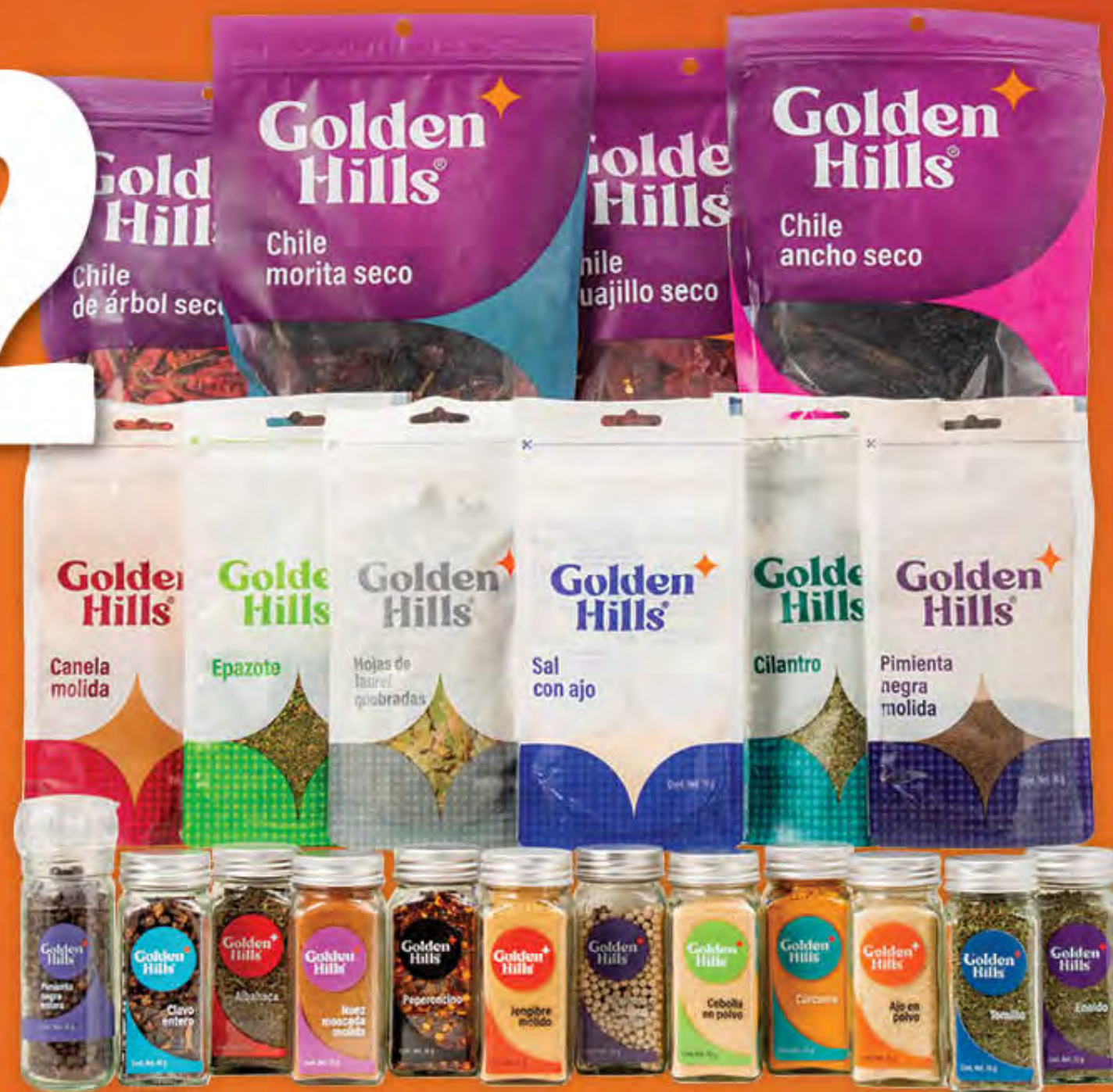
ESPECIAS Y CHILES SECOS GOLDEN HILLS