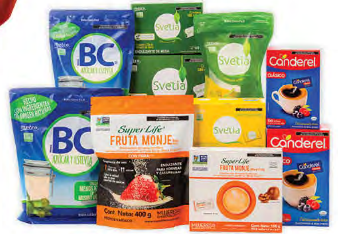
ENDULZANTES SVETIA, AZÚCAR BC, CANDEREL Y SUPER LIFE