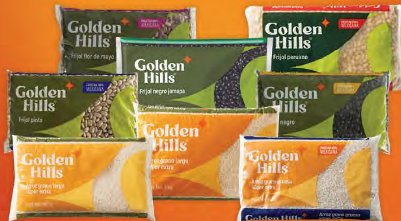
ARROZ Y FRIJOL GOLDEN HILLS