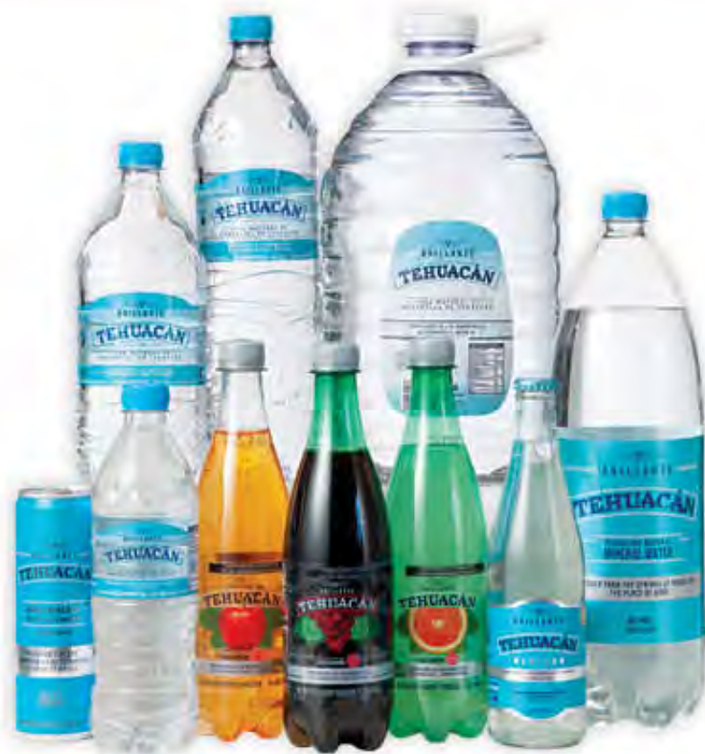
AGUAS MINERALES, REFRESCOS Y AGUA NATURAL TEHUACÁN BRILLANTE