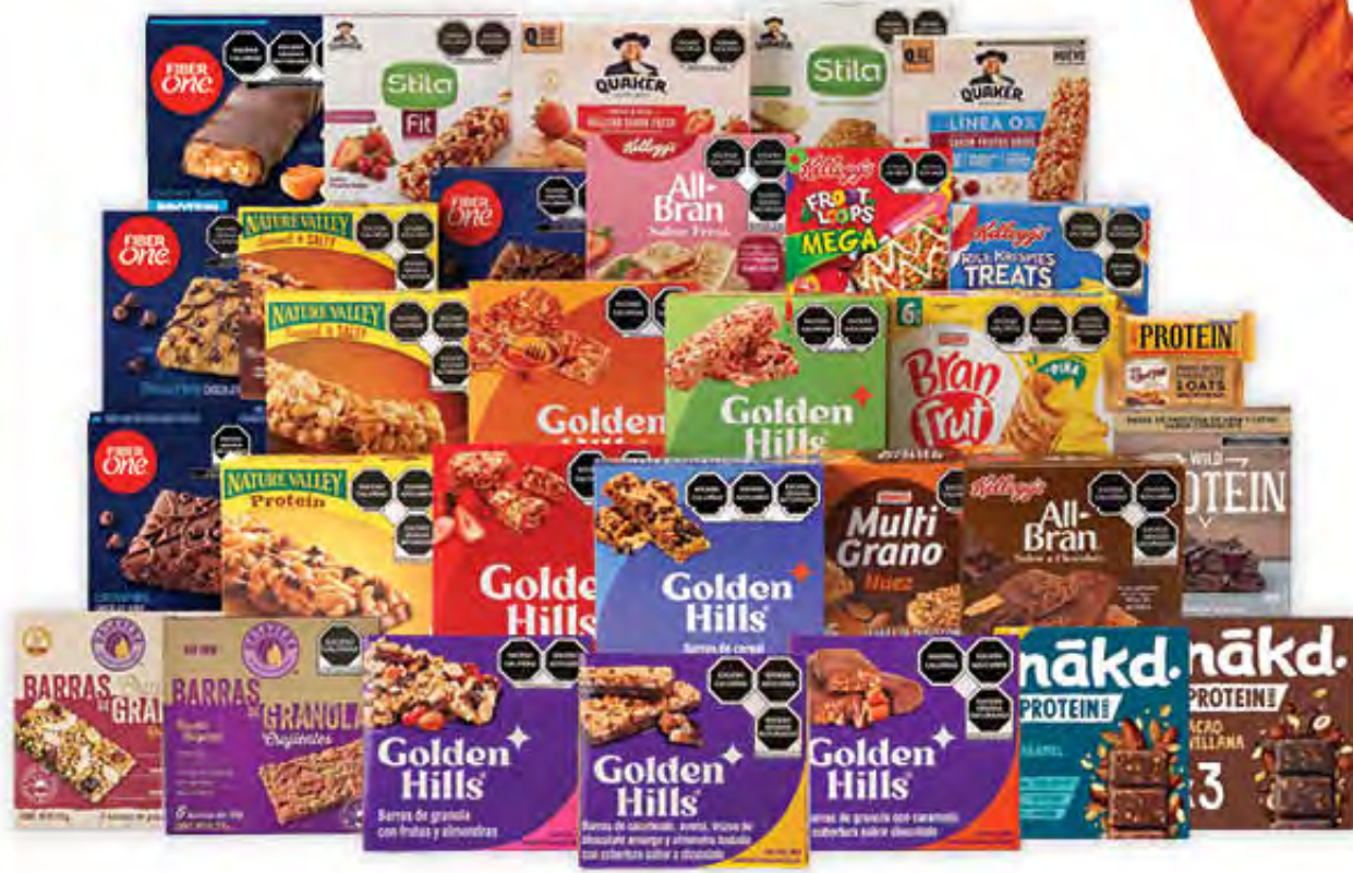
TODAS LAS BARRAS DE CEREAL