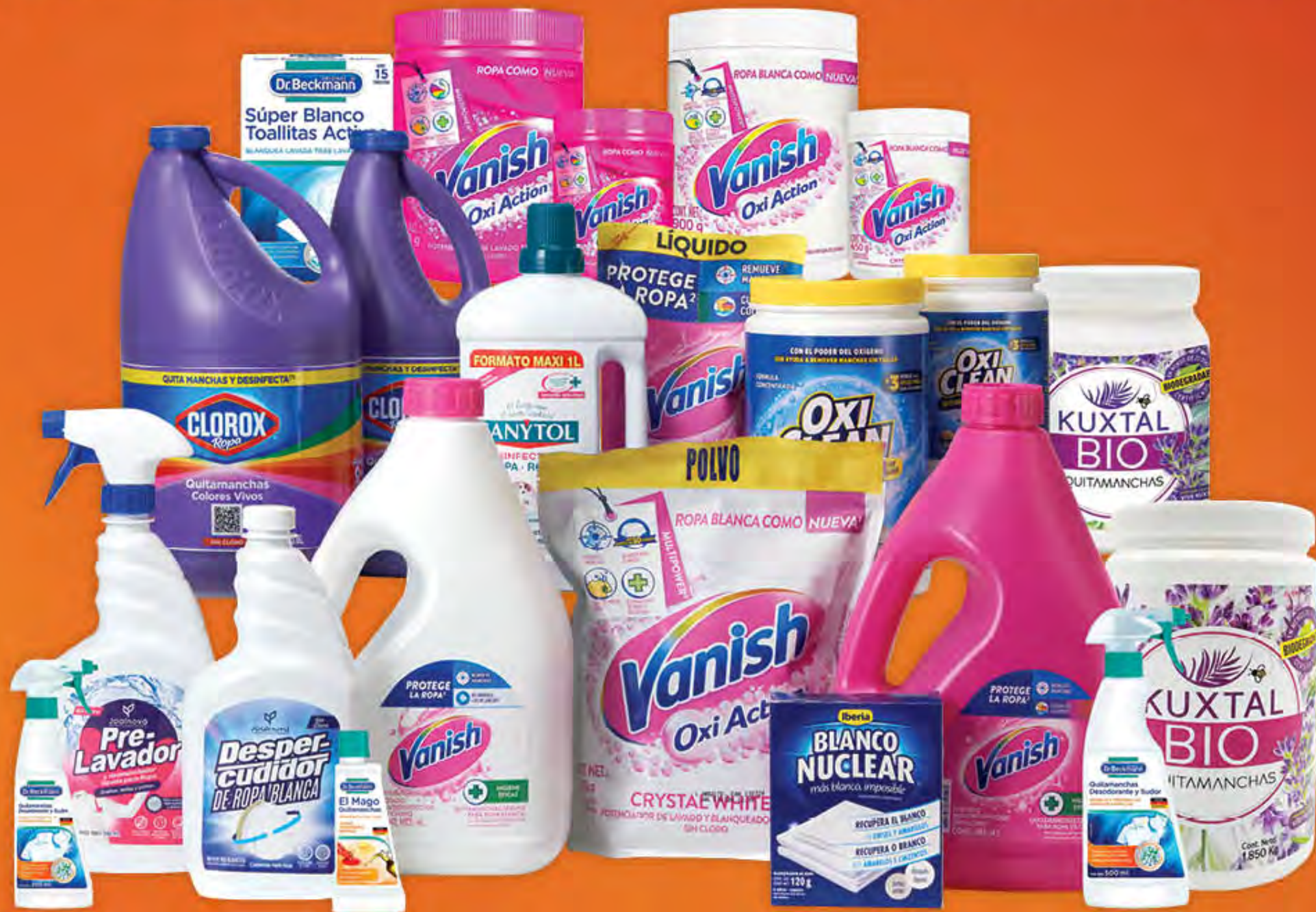
TODOS LOS DESMANCHADORES Y PRELAVADORES