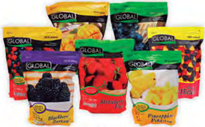
FRUTAS CONGELADAS GLOBAL PREMIER