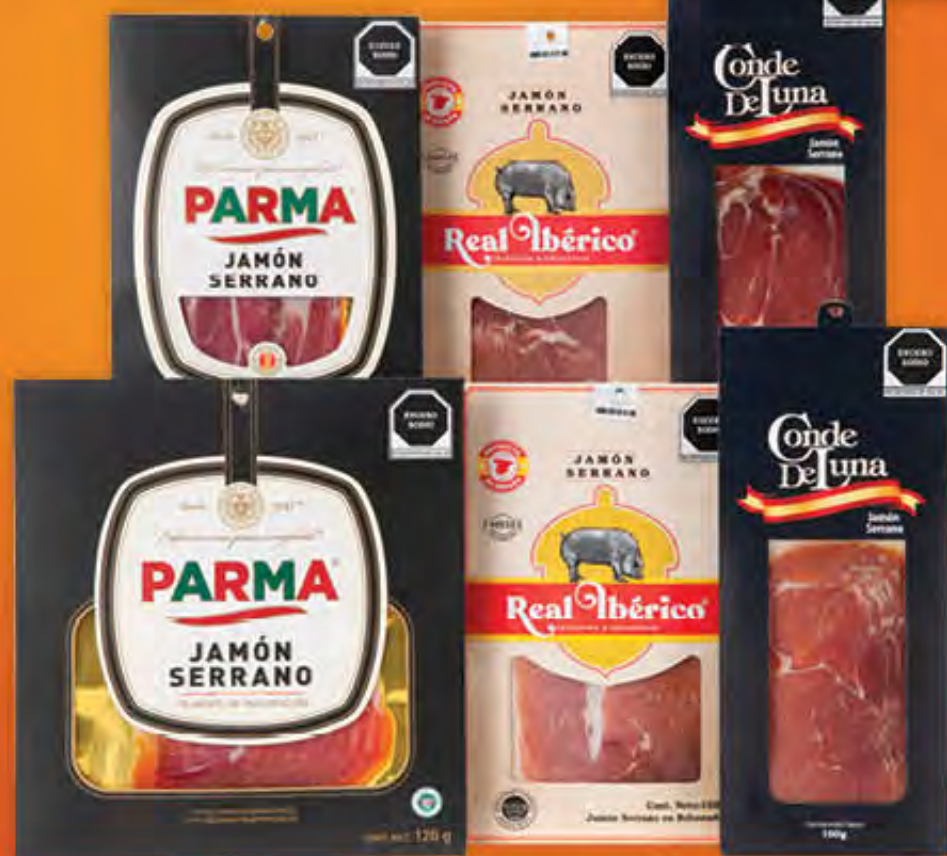
JAMONES SERRANOS EMPACADOS PARMA, CONDE DE LUNA Y REAL IBÉRICO