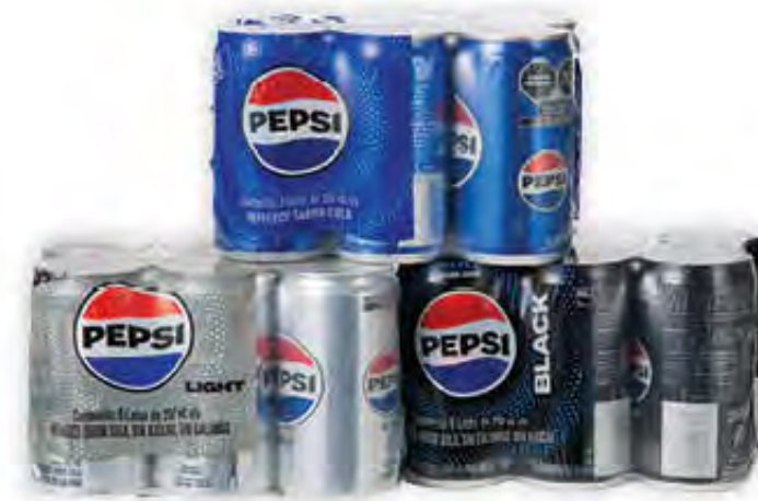
REFRESCOS MINI LATAS PEPSI 237ML