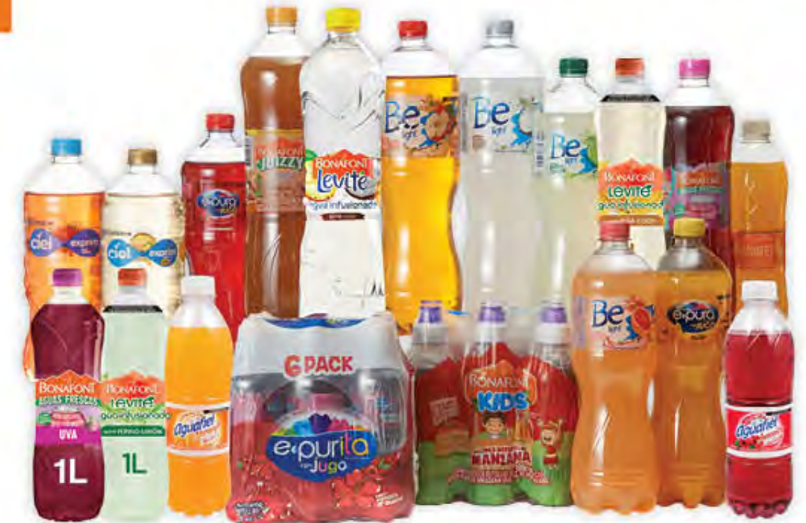
TODAS LAS AGUAS SABORIZADAS