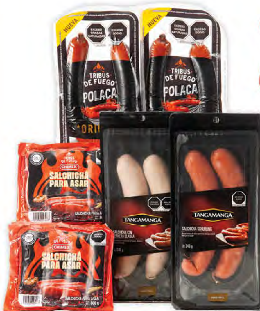
PRODUCTOS PARA ASAR TANGAMANGA, CHIMEX O TRIBUS DE FUEGO