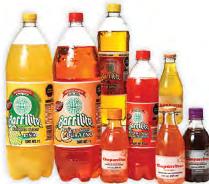
REFRESCOS CHAPARRITAS Y BARRILITOS