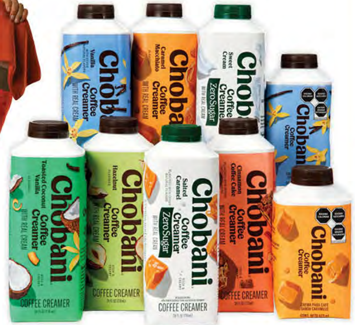
CREMAS PARA CAFÉ CHOBANI